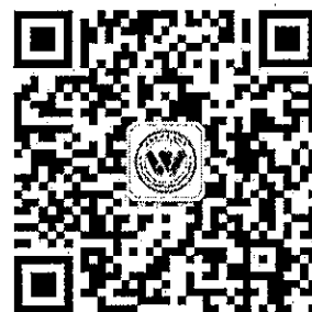
协会公众号登录码